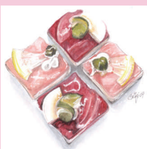
Amuse Bouches: Minimum 4 Stück pro Sorte