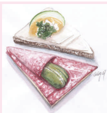
Party-Canapés: Minimum 2 Stück pro Sorte